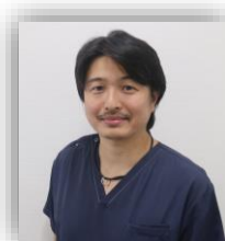
文責 竹内 太郎

開腹・開胸手術が困難と思われる高度肺気腫患者でも、低侵襲なステントグラフト治療にて治療可能な場合もあります。まずはお気軽にご連絡ご相談ください。